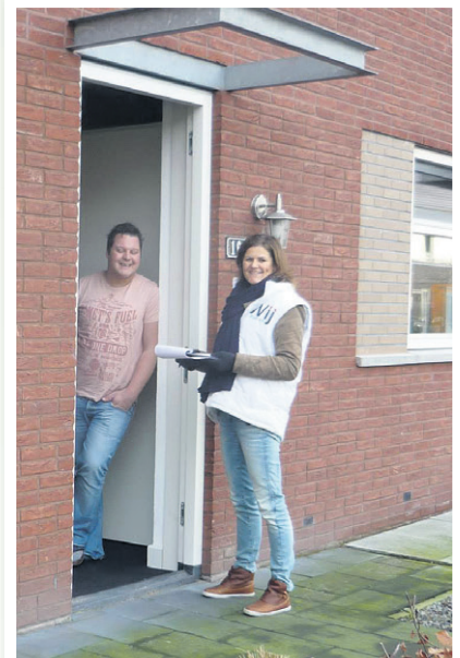
Al gooide corona de afgelopen periode roet in het eten, Wij Putten wil elke raadsperiode bij elke voordeur aanbellen om te horen wat er speelt in de wijk. De waardering is groot en het leidt soms tot verrassende initiatieven.