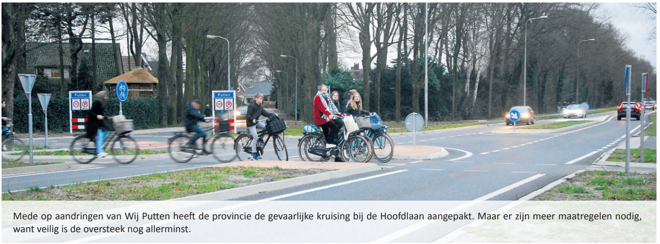
Mede op aandringen van Wij Putten heeft de provincie de gevaarlijke kruising bij de Hoofdlaan aangepakt. Maar er zijn meer maatregelen nodig, want veilig is de oversteek nog allerminst.