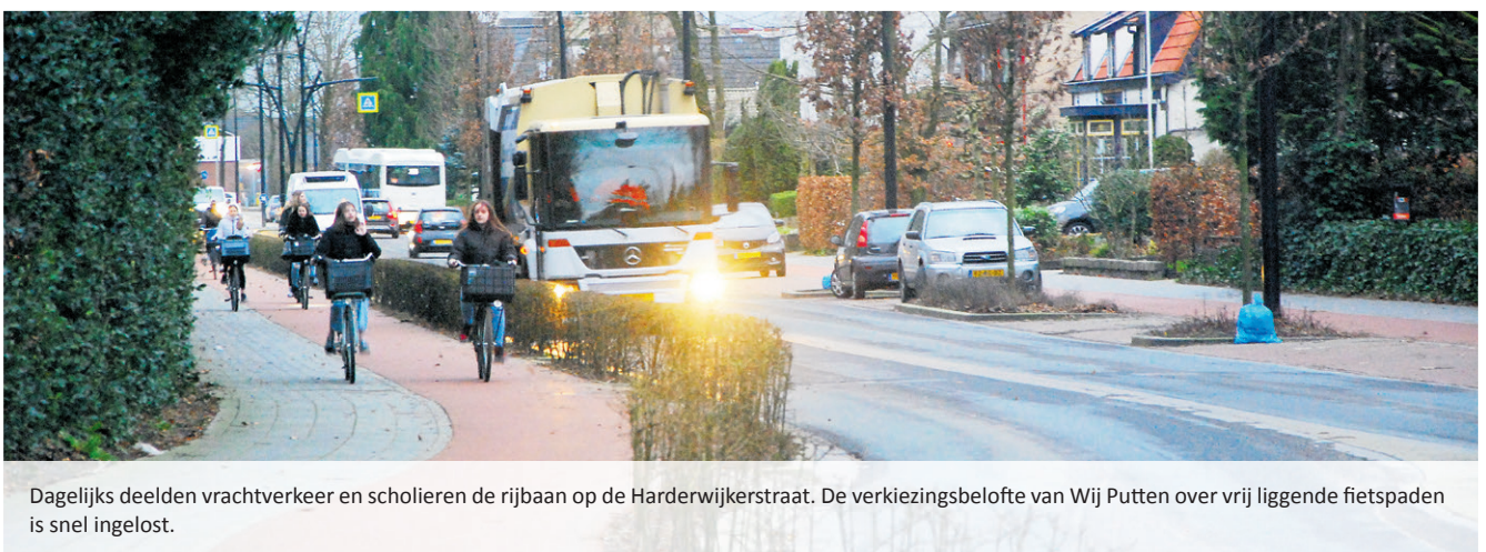
Dagelijks deelden vrachtverkeer en scholieren de rijbaan op de Harderwijkerstraat. De verkiezingsbelofte van Wij Putten over vrij liggende fietspaden is snel ingelost.