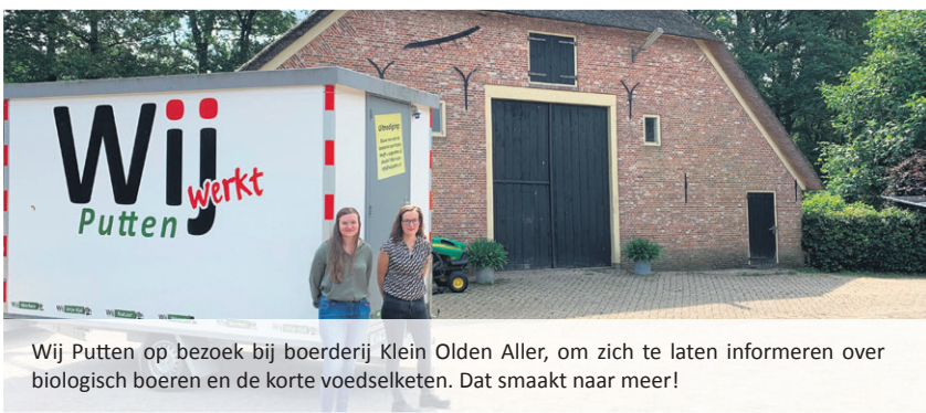
Wij Putten op bezoek bij boerderij Klein Olden Aller, om zich te laten informeren over biologisch boeren en de korte voedselketen. Dat smaakt naar meer!