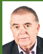
10. Roelof Koekoek