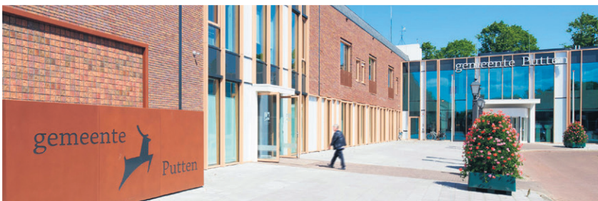
Vergane glorie en energielabel Z: het gemeentehuis was hard aan een opknopbeurt toe. Het is nu klaar voor de toekomst en inmiddels liggen ook de pleinen er weer pico bello bij.